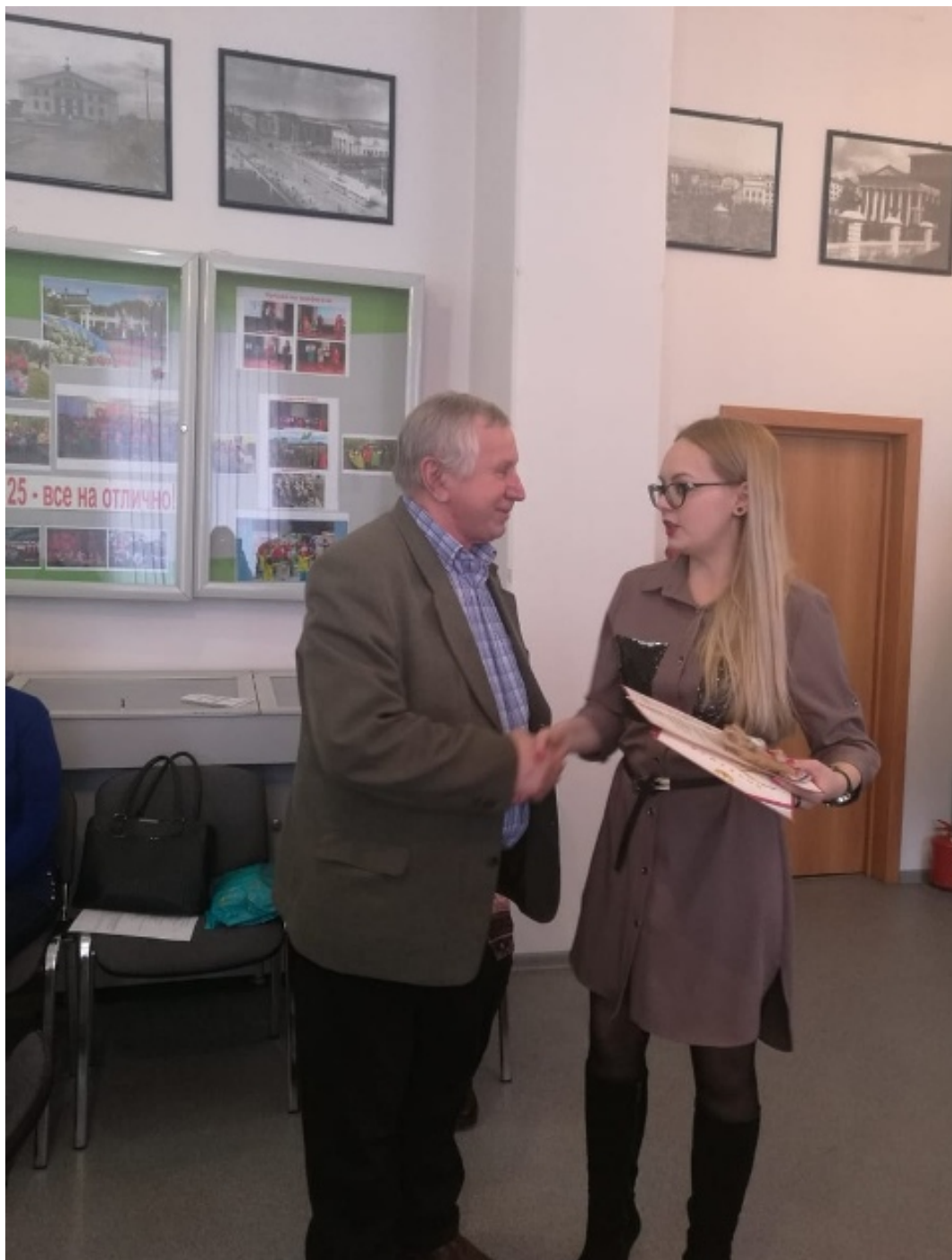
Вручение диплома победителю муниципального этапа чемпионата по компьютерному многоборью среди пенсионеров